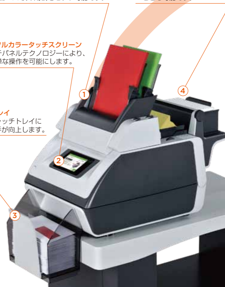
※2.5ステーションの場合

4. 短冊/返信用封筒フィーダー ドキュメント用紙に加えて、返信用封筒などを封入することも可能です。