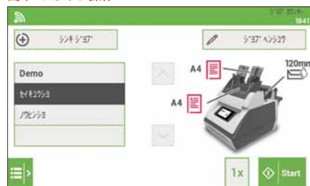
①書類と封筒をセットし、ジョブを選択