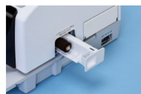
●交換式インクカートリッジ

オプションのジャーナルプリンタを搭載すると、日報・月報をプリントアウトすることができます。さらに、スタンプ後に本体上で用途区分等の設定内容（納付金額を除く）を変更することができるので、修正後の正しいデータを印刷することができます。また、USBメモリ・LAN接続で使用データをCSV形式でPCに取り込みデータ管理が可能です。（LAN接続はFTPサーバーを構築していただく必要があります）