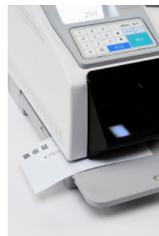
●スタンプ位置はライトで視認

用途や使用部課などの区分、税テーブルなど多彩な機能を搭載していますので、印紙管理業務の効率化を実現します。