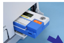
●予納式のカウンタ

使用者キー・管理者キーで権限の区分ができますので、高額納付などの制限をかけることが可能です。また、パスワード、使用者コード、補助コードなどの機能を使うことにより詳細なデータ管理が可能になります。