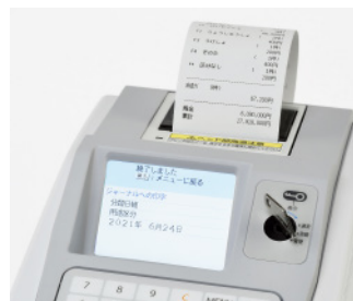
●ジャーナルプリンタ（オプション）